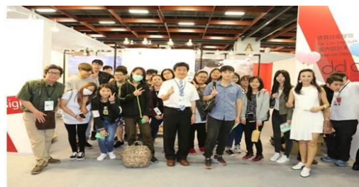
2017德霖室設畢業展 新一代設計展(台北世貿)