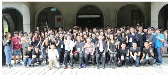
2017德霖室設畢業展 台北市松山文創中心

本學院結合理論觀念與實務技術，將設計理念作一整體表達。規劃舉辦學生畢業展覽，學生組成畢展會，發揮團隊精神，合力籌劃展覽事宜，於校外選擇具有特色的適宜地點與空間展示場所，或與他校進行聯合展覽，同時邀請產、官、學界相關人士蒞校參觀。其目的除了培養就業能力外，並製造學生與業界接觸機會，增加學生就業機會，成果豐碩。