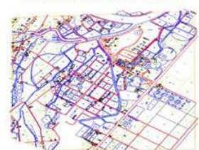
規劃無人載具空拍測繪系統