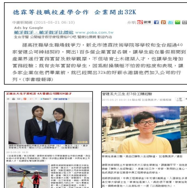
圖 學生實習校外實習