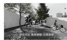
課程特色 專業學習-空間美學 虛擬實境渲染及動畫