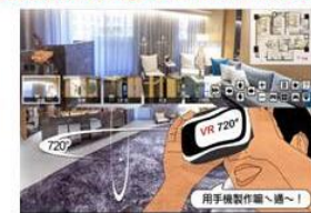
規劃720度空間環景系統