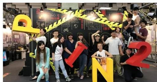
2018德霖室設畢業展 新一代設計展(台北世貿)