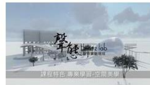
課程特色 專業學習-空間美學 虛擬實境渲染及動畫