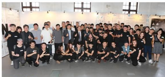
2018德霖室設畢業展 台北市松山文創中心