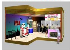
商業空間虛擬設計