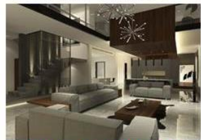
虛擬實境渲染及動畫