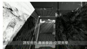
課程特色 專業學習-空間美學 虛擬實境渲染及動畫

本學院積極將 3D 建築資訊應用於專業領域上，例如虛擬實境渲染及動畫、商業空間虛擬設計及 3D 建築資訊模型，另外已規劃無人載具空拍測繪系統及規劃 720 度空間環景系統。其中，3D 建築資訊模型 (Building Information Modeling, BIM) 在不動產業已成為重要的發展趨勢。不動產學院為提升學生在建築資訊模型的技能及應用，已開設 3D 電腦輔助設計課程及建置 BIM 所需軟硬體設備(包含電腦教室及 Autodesk Revit 系列軟體)。