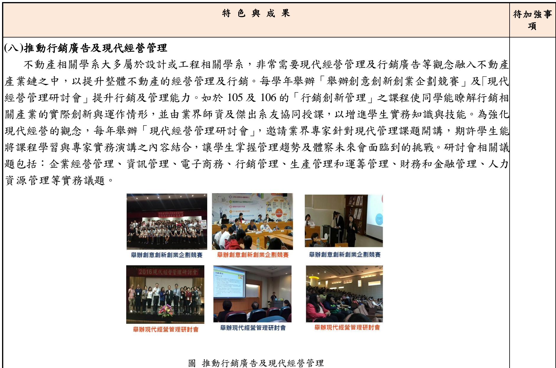
圖 推動行銷廣告及現代經營管理